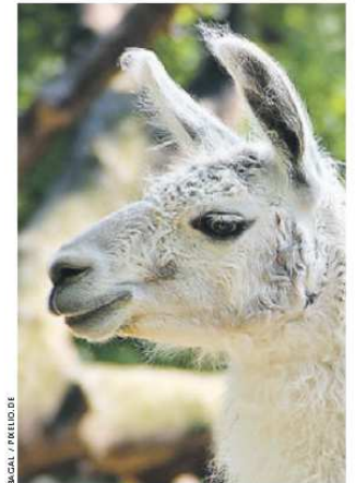
BAGAL / PIRELLA GÖTTSCHE LOWE

In Erfurt und Weimar profitieren auch die Kleinsten vom politischen Wettbewerb