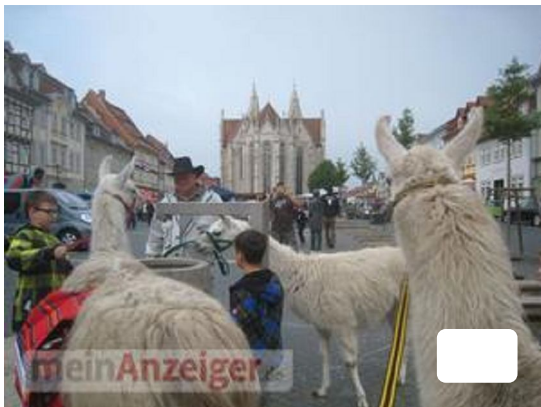
Die Unstrut-Lamas in Mühlhausen am 1. Mai